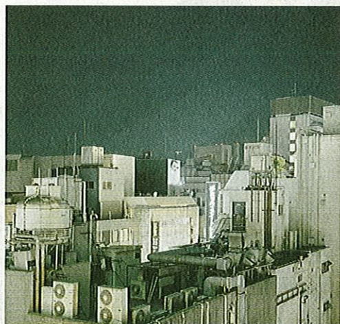
«Fine Arts»: Verschlussenes Japan.

Wesentlich wortreicher geht es am nächsten Morgen zu: Die Spielregeln wechseln, nun zählt einzig das Argument. «Kitschig wie Schlagrahm auf Schokoladekuchen» – lakonische Kommentare durch den Raum, dann wiederum entlocken sich feinsinnige Wortwechsel um Stimmungen und Strategien. Immer wieder zu reden gibt