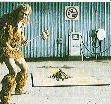
Kategorie «Werbung»: Unsinn verkauft sich.