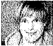
Fotografin Tine Edel

Doch handelt es sich hier «nur» um Werbung, ein Kundengeschenk: Die Bilder bilden den Jahreskalender der Gossauer Recyclingfirma Solenthaler, fotografiert hat Tine Edel. Nun sind