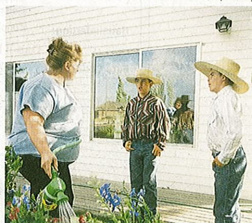
«Fine Arts»: Echte Cowboys in Oregon.

Die Qual der Wahl – an diesem Februarnachmittag war sie buchstäblich spürbar. Denn sie tut körperlich weh. Gerötete Augen und verspannte Nacken plagen die sechs Juroren. Aus Frankreich, Deutschland und dem Inland sind sie angereist, um in der Schweizer Fotoszene den Kehraus zu machen. Die 3000 eingegangenen Bilder liegen auf dem Boden der ehemaligen Turbinenhalle an der Hand aus. Alle im selben Format, zum sportlichen Vergleich in vier Kategorien zusammengeführt: Werbung, Redaktionell, Fine Arts und Free.