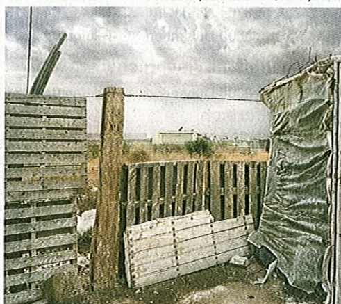
«Redaktionell»: Unbekanntes Andalusien.