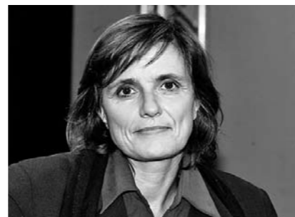
Powerfrau. Kritikerin Iris Radisch wirkt in der Buchpreis-Jury mit.

diesem Jahr wird den Juroren das umfangreiche Lesepensum auf einem elektronischen Lesegerät zur Verfügung gestellt. Eine Fachjury wird aus den Einreichungen eine rund 20 Titel umfassende Longlist herausdestillieren, die am 19. August bekannt gegeben wird. Daraus wählen die Juroren sechs Titel für die Shortlist, die am 16. September veröffentlicht wird. Preisverleihung ist am 12. Oktober. SDA