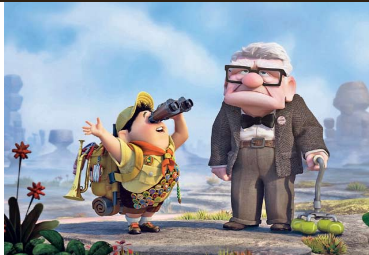
Durchs Glas geschaut. Der Eröffnungsfilm «Up» wird in Cannes in 3-D zu sehen sein.